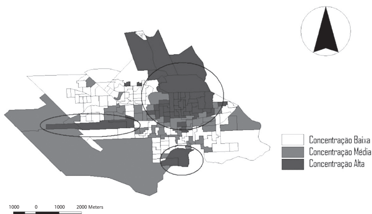
FIGURA 3 – Quociente de Localização (LQ) de MNI Alto Cidade de Neuquén, 1991

o caso das metrópoles norte-americanas, começou a ser acompanhado de um elemento que ganharia peso conforme nos aproximamos do presente: a periferização dos padrões habitacionais dos membros mais abastados da sociedade. Isto é especialmente evidente no caso das áreas conhecidas como “Jardines del Rey” (no Sul), “Rincón Club de Campo” (no Norte), “Consortio San Martín” e “Barreneche” (ambos no Oeste). Também com uma localização periférica, ainda que com características muito diferentes dos anteriores, devemos mencionar os complexos habitacionais construídos para dar solução ao déficit habitacional que enfrentavam os trabalhadores da educação na capital de Neuquén (“MUDON” e “MUTEN” no Noroeste). Em resumo, os padrões de assentamento do grupo que ocupava a cúspide da classificação assemelhava-se a um “continente” localizado no centro e a um punhado de “ilhas” que começavam a surgir na periferia (Figura 3).